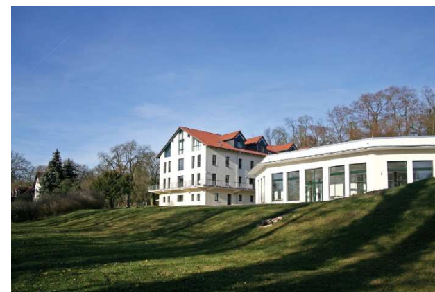
Die Heimvolkshochschule am Seddiner See

Allein Gott in der Höh' sei Ehr - 2 Chöre